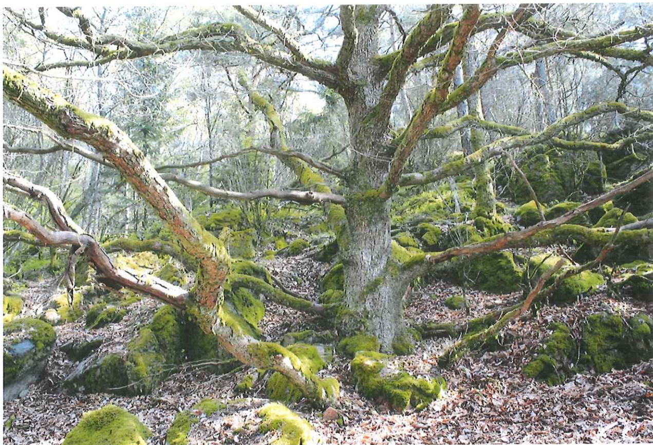
The Wholly Oak Tree – Sollidens centrala paraplyträd och symbol för naturvärdena i skogen.