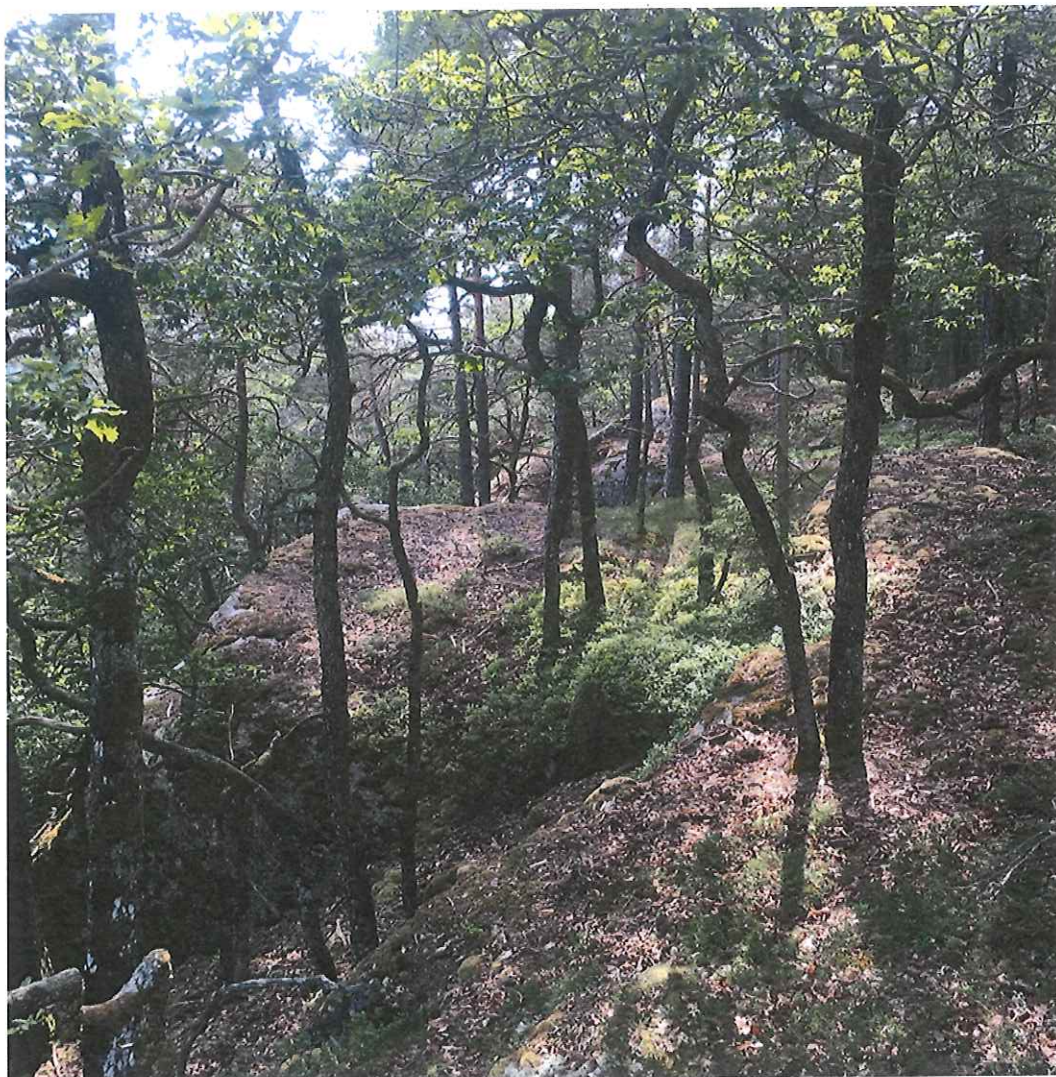
"Dansande skogen" – En del av Skarnhållans gammelskog med höga naturvärden.